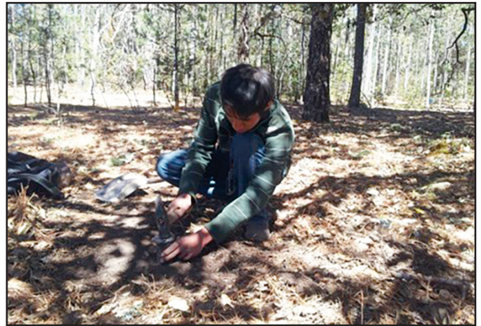
Figura 3. Colecta de muestras de suelo.

la biomasa aérea del arbolado se hizo mediante los modelos alométricos generados por Vargas-Larreta et al. (2017) para las especies arbóreas más importantes del estado de Durango (tabla 1). Durante el proceso, las variables independientes (diámetro normal y altura total) se sustituyeron de acuerdo a cada especie encontrada en los sitios de muestreo.